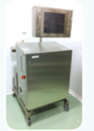
온라인 입도 분석기